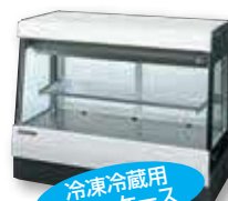
冷凍冷蔵用 ショーケース